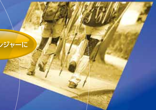
アウトドアレジャーに