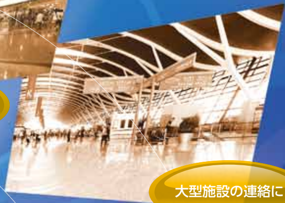
大型施設の連絡に