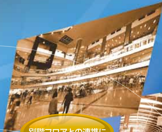
別階フロアとの連携に