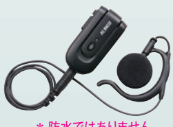
ワイヤレス・イヤホンマイク EME-80BMA