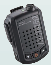
高性能ノイズキャンセラー内蔵ワイヤレス・スピーカーマイク 音声出力3W EMS-87BNC