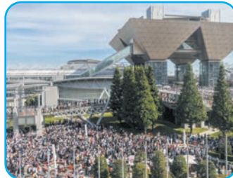
イベント・レジャー...