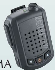
ワイヤレス・スピーカーマイク 音声出力3W EMS-87B