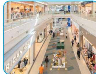
ショッピングモール...