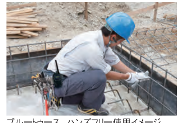
Bluetooth ハンズフリー使用イメージ