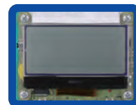
従来モデルの液晶部