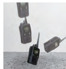
落下試験イメージ

強化エラストマ素材を採用したラバープロテクションケースを装着することによって落下などによる強い衝撃から無線機を保護することができます。ラバープロテクションケースを装着して無線機を2mの高さからコンクリートの床に6方向(上面/底面/左右側面/前面/背面)から落下させる厳しい落下試験をクリアしています。