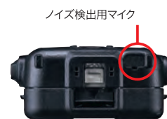
ノイズ検出用マイク