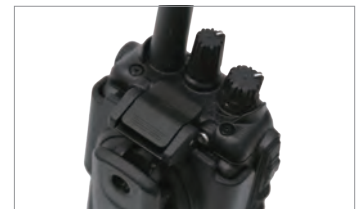
ワンタッチリリースホルスター (SHB-100)

ベルトに装着したまま、ホルスター上部のフックを押すだけのワンタッチ操作で無線機を外して素早い応答が可能です。通信終了時の無線機の装着もワンタッチで行うことができます。アングルフリー (回転式) のベルトクリップは、作業がしやすい最適な位置に調整ができるので作業の邪魔になりません。