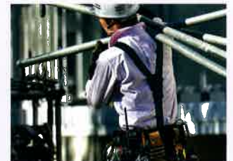
ケーブルレス Bluetooth 利用イメージ