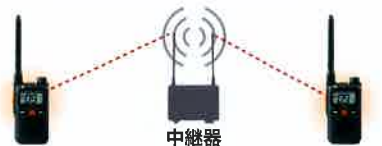
中継器接続で交互通話の約2倍にエリアを拡大

交互通話に加え、中継通話用チャンネルを装備しており中継器に接続することで交互通話の約2倍に通話エリアを拡大できる他、多層階のビル内や別棟との連絡、不感エリアの改善などに利用が可能です。